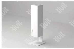
INSTALLAZIONE CON SUPPORTO A PAVIMENTO