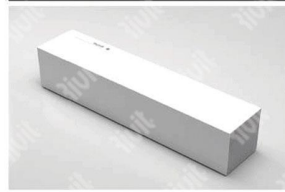
INSTALLAZIONE IN APPOGGIO SU MOBILE O MENSOLA