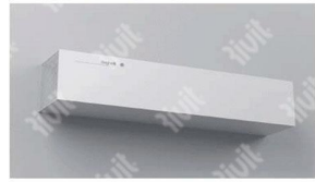
INSTALLAZIONE A PARETE