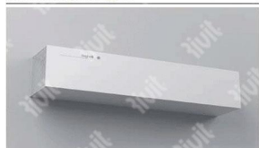
INSTALLAZIONE A PARETE