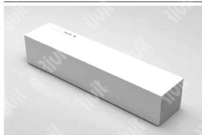
INSTALLAZIONE IN APPOGGIO SU MOBILE O MENSOLA