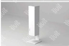
INSTALLAZIONE CON SUPPORTO A PAVIMENTO